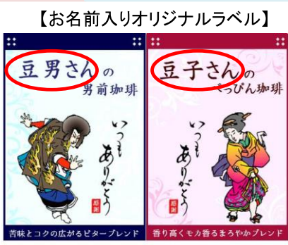
【お名前入りオリジナルラベル】 〇の部分にお父様、お母様のお名前が入ります

皆さん、日頃の感謝の気持ち伝えていますか？いつも感謝はしているけれど口に出して言えてなかったり、形にしてなかったり、伝わっていると思っていても、やっぱりちゃんと伝わっていません。今年はコーヒーでも、と考えていらっしゃる方にご案内です。ビーンズではここ数年、お母さんのお名前入り「べっぴんさん」、お父さんのお名前入り「男前珈琲」を作っています。この時期だけのスペシャルな企画。コーヒー好きのお母さん、お父さんでしたらきっと喜んでいただけたらと思います。ビーンズスタッフ陣、真心こめてお作りいたします☆ お名前入りラベルは完全予約制なので、気になる方はスタッフまでお声おかけください！全国発送（送料660円）も承ります！